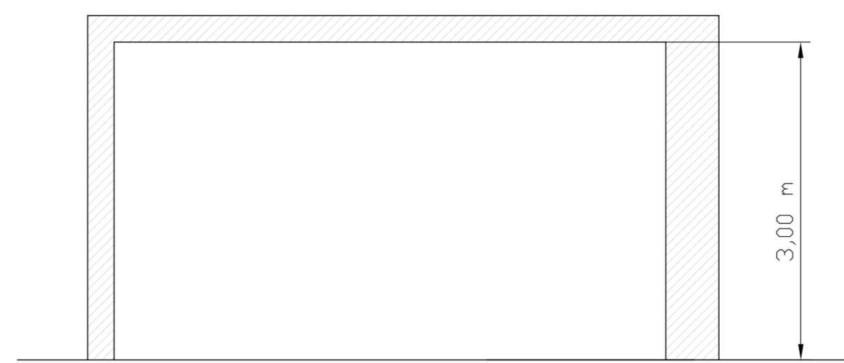
SEZIONE A-A LOCALE TECNICO - SCALA 1:50